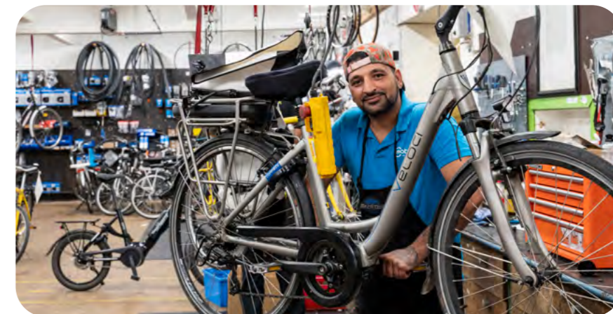
In 2025 legde Mobiel de focus op het herstel en verkoop van tweedehands fietsen.

De andere Mobiel-activiteiten bleven relatief stabiel. Fietsverhuur daalde licht naar €422.068 (-8%), maar is wel de grootste omzetpijler binnen het Fietsencentrum. Tegelijk stijgt de verhuur van recreatieve fietsen iets door het online reserveringssysteem. Hoewel het aandeel studenten in het klantenbestand aangroeide, opteerden zij minder snel voor de huur van de Mobiel-studentenfiets