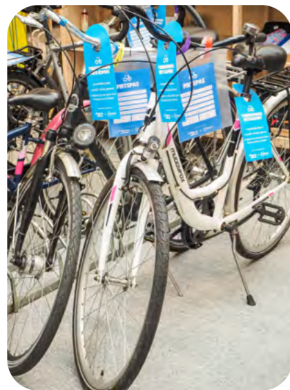
De door Mobiel klaargezette fietsen zijn beschikbaar in alle Kringloopwinkels.