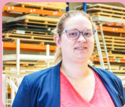
Santhia is uitgegroeid tot een vaste waarde in alles wat operationele software linkt met boekhouding en personeelsadministratie.

In juli 2015 begon ze bij De Kringloopwinkel. Na het bouwverlof wisselde ze al snel van werkplek: