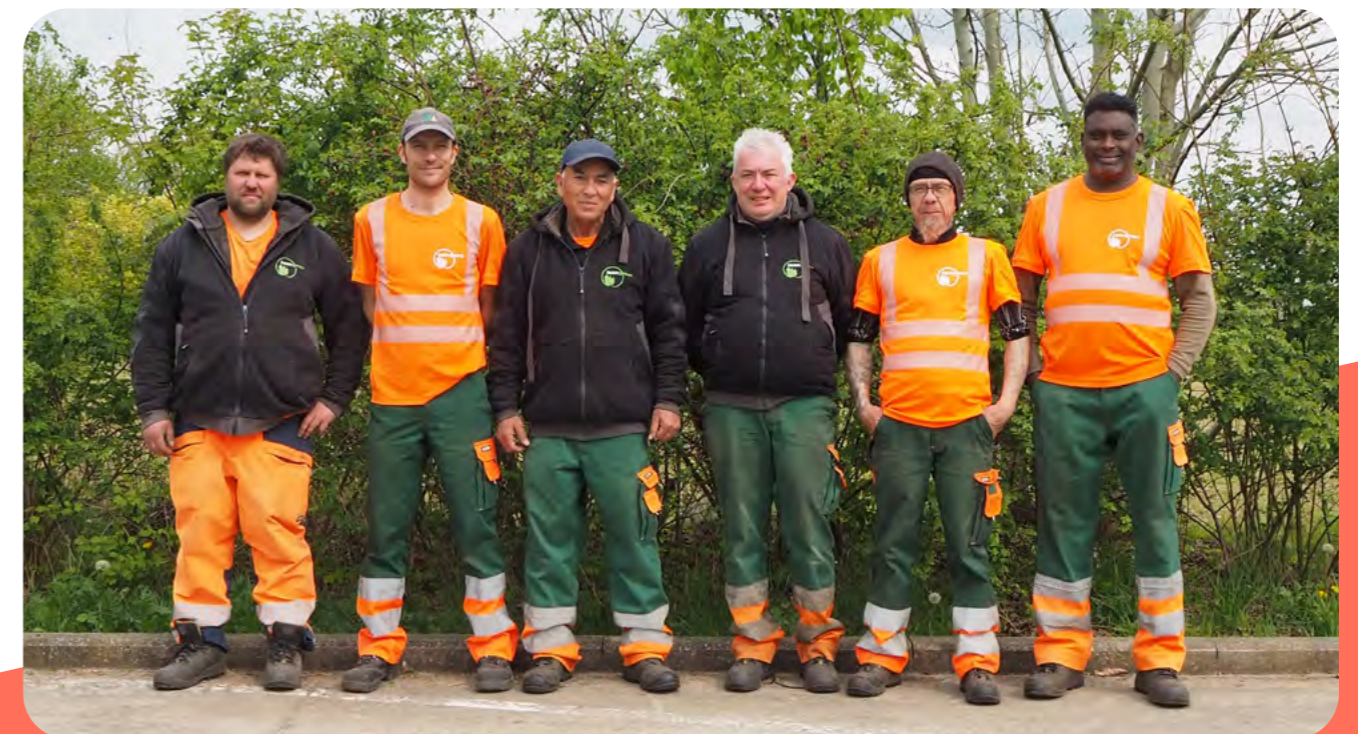
Team Kruid en Blad houdt het straatbeeld op orde.

"Het is arbeidsintensief werk waar we ook geen gebruik maken van bestrijdingsmiddelen. Vooral tijdens de zomer is het alle hens aan dek. Met de uitbreiding kunnen we dit aan en is er ook meer flexibiliteit."