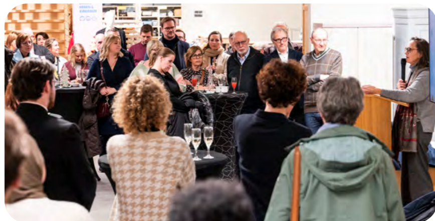
De nieuwe winkel Wevelgem Vliegveld lijkt qua stijl en grootte op De Kringloopwinkel in Beveren-Leie.

De voorbereidingen aan de nieuwe winkel waren pittig: verbouwingen, intense opleidingen voor de nieuwe ploeg medewerkers, de openingsweek voor klanten en de