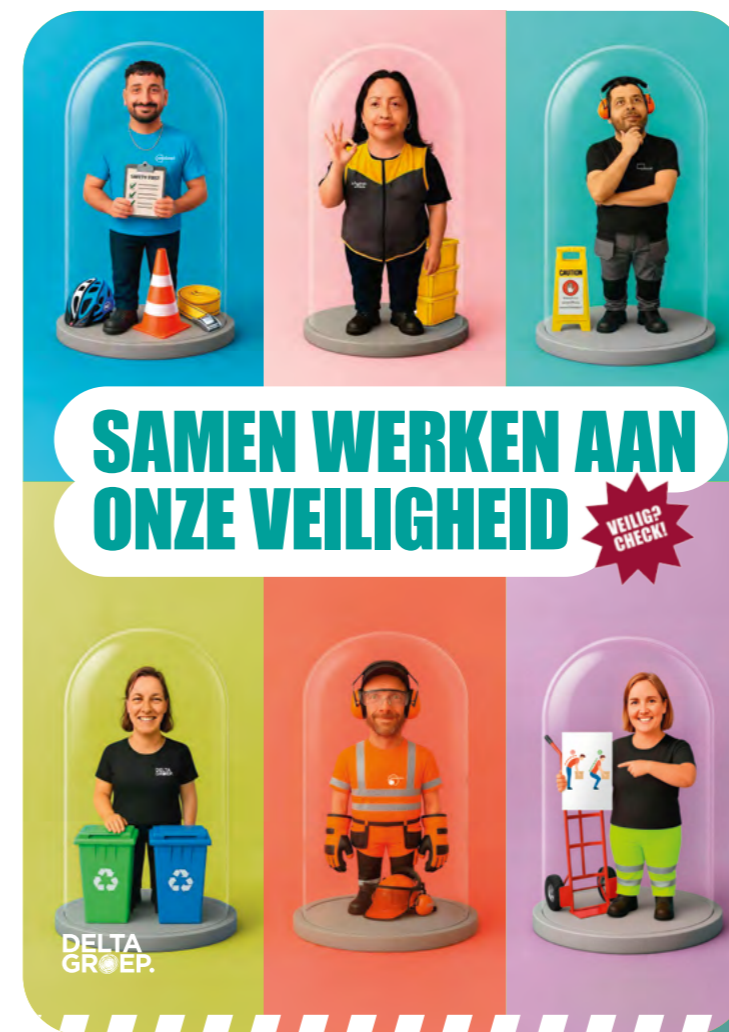
Zes collega's verbeelden zes preventie- en netheidsthema's.

"Zorgzaam en Veilig maakt duidelijk dat preventie een gedeelde verantwoordelijkheid is. Het is een campagne vóór én met iedereen. Duurzaam ook, zowel op gebied van materiaal als qua inhoud. De ambitie is om van Zorgzaam en Veilig een blijvende reflex te maken", aldus Merijn.